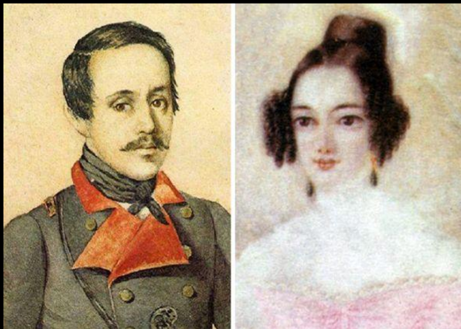
Михаил Лермонтов и Екатерина Сушкова