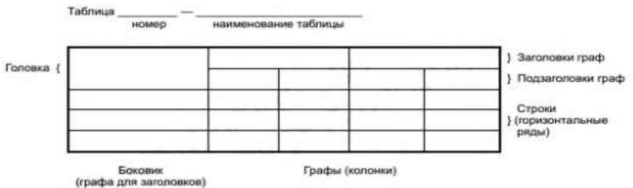
Рисунок 2 – Основные элементы таблицы

Основные элементы таблицы представлены на рисунке 2.