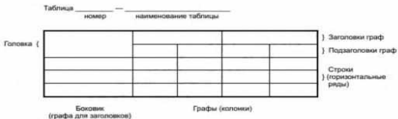
Рисунок 2 – Основные элементы таблицы

Таблицу с большим количеством строк допускается переносить на другую страницу. При переносе части таблицы слово «Таблица», ее номер и наименование указывают один раз слева над первой частью таблицы, а над другими частями также слева пишут слова «Продолжение таблицы» и указывают номер таблицы.