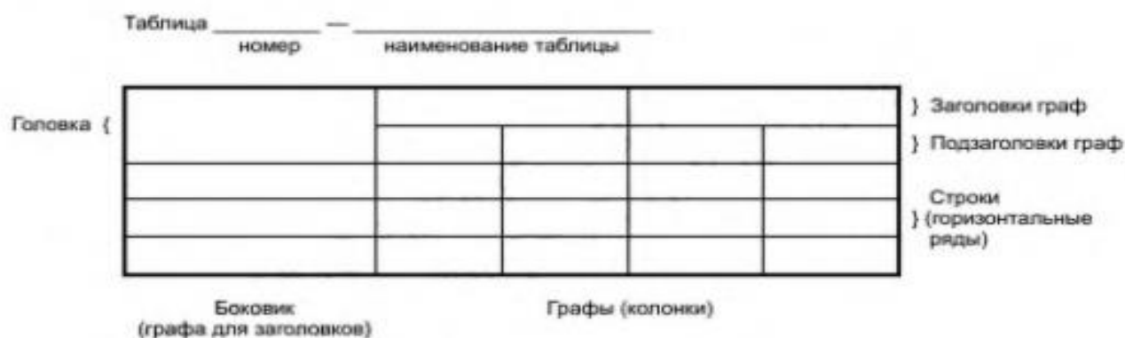
Рисунок 2 – Основные элементы таблицы

Таблицу с большим количеством строк допускается переносить на другую страницу. При переносе части таблицы слово «Таблица», ее номер и наименование указывают один раз слева над первой частью таблицы, а над другими частями также слева пишут слова «Продолжение таблицы» и указывают номер таблицы.